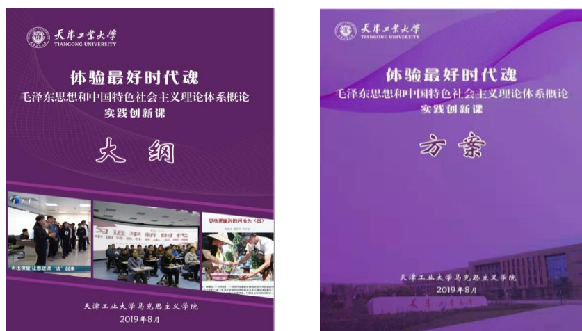
实践创新课大纲、方案封面