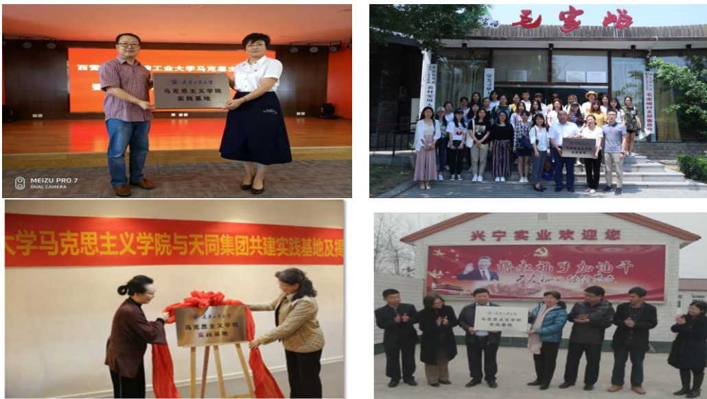
部分实践基地挂牌照片（其他见附件）

学院最终与 13 个基地正式签约、挂牌，与 4 个基地确立了明确合作关系，共开辟了 17 个实践基地。实践基地类型多样，包括了党政机关 3 个、企业 3 个、农村 2 个、学校研究院 2 个、纪念馆博物馆 7 个。实践基地主题覆盖了概论课全部 14 个章节。实践教学体系与教材体系各章一一对应，保证了在教学的任何一章都有实践基地支撑。