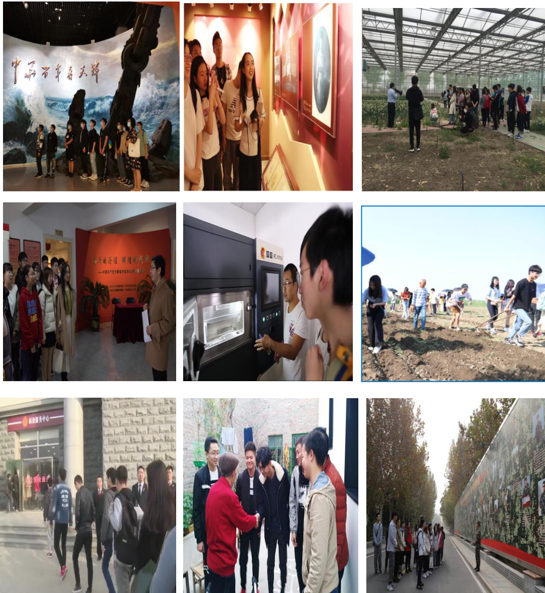
部分实践创新课教学照片（其他见附件）