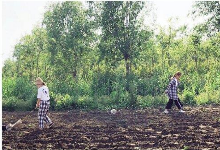
部分新闻报道截图