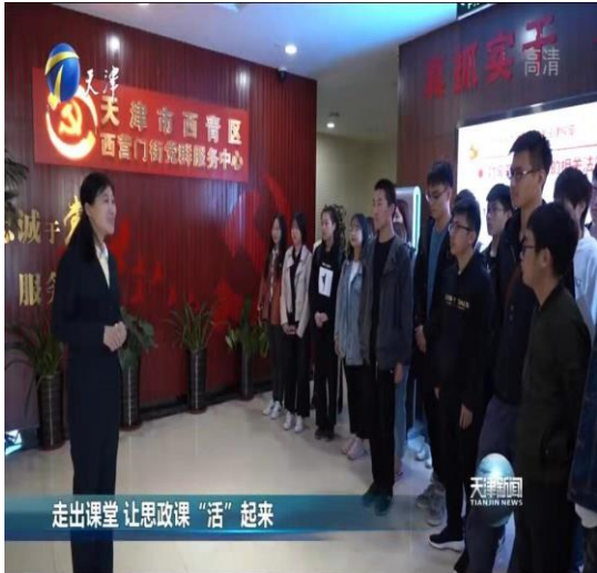
走出课堂 让思政课“活”起来